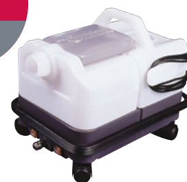
Tapijextractie machine – Injecteur-extracteur pour tapis