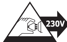
Minden egyes használatot követően